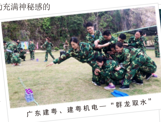
广东建粤、建粤机电“群龙取水”