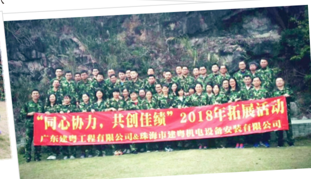
广东建粤、建粤机电一大合照