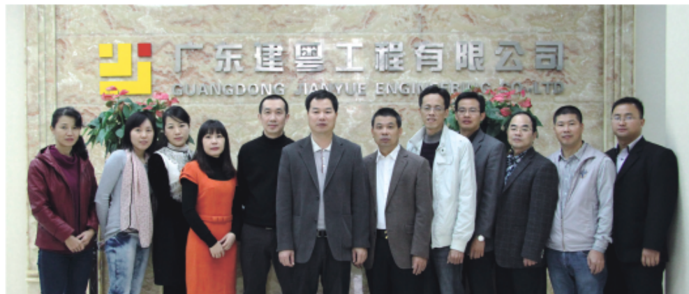
(广东建粤管理团队乔迁合影)

(通讯员 夏小燕) 2012年10月11日, 广东建粤工程有限公司举行乔迁新址庆典仪式, 各级领导, 各界朋友、行业代表以及合作单位在内的近300人出席了庆典酒会。